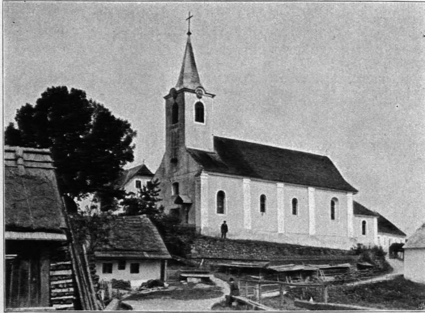
Fig. 318 Jagenbach, Pfarrkirche, Ansicht von Südwesten (S. 339)