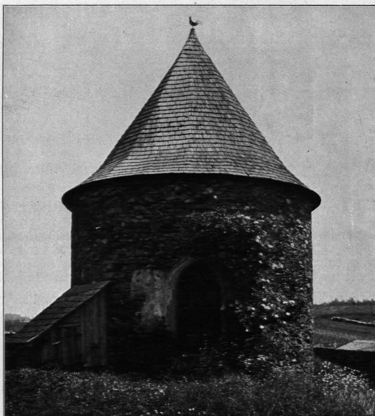
Fig. 314 Groß-Göttfritz, Karner, Ansicht von Westen (S. 334)

Glocken: Zwei Glocken, (Kreuz) FR — NR — MG; gegossen von Jenichen in Krems 1814. — Eine dritte