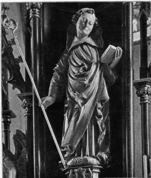
Fig. 312 Groß-Göttfritz, Pfarrkirche, gotische Statue des hl. Leonhard am Hochaltare (S. 334)