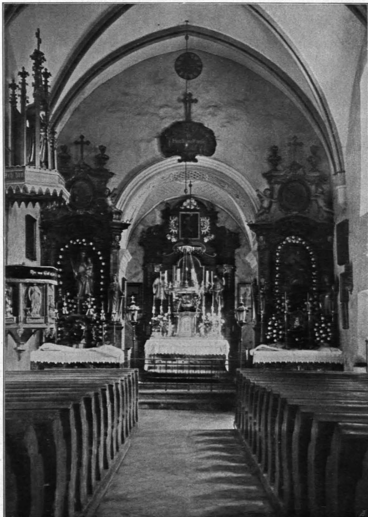
Fig. 303 Groß-Globnitz, Inneres der Pfarrkirche, Ansicht von Westen gegen den Chor (S. 325)

2. Linker Seitenaltar: Einfache holzbekleidete Mensa. Tabernakel mit zwei auf seitlichen Voluten knienden Putten und vergoldetem geringem Relief (Schlüsselverleihung an Petrus) auf dem Türchen. Wandaufbau (Kunstmarmor): Nische mit moderner Marienstatue, flankiert von rechteckigen Pilastern mit Cherubsköpfchen als Kapitälern, darüber verkröpftes, in der Mitte aufgebogenes Gesims mit Kartusche und Blumengewinde. Aufsatz mit modernem Ovalbilde und zwei Putti (Holz, polychromiert), geschwungenem Abschlußgesimse, zwei Flammenurnen, Kreuz. Mittelmäßig. Ende des XVIII. Jhs.