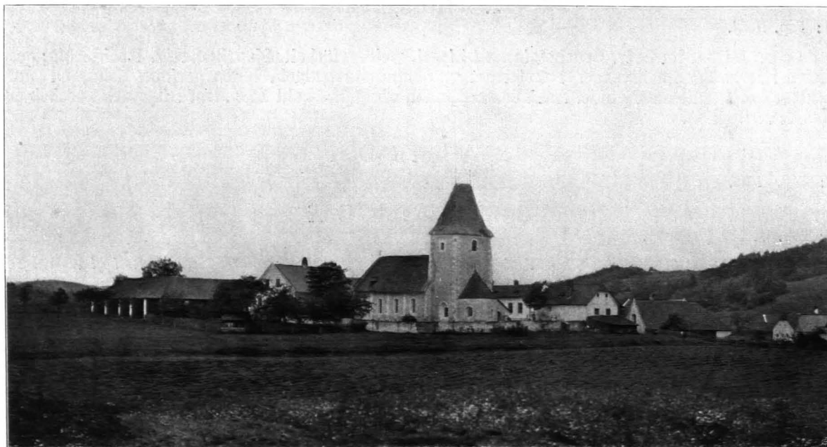
Fig. 224 Oberkirchen, Gesamtansicht von Südosten (S. 259)

Sigmund, Abt zu Lambach, erklärte 1308, daß sein Kaplan Valentin zu Oberkirchen den Zehent zu Böhmstorf und Wurmbrand von der Gnade des Abtes Otto von Zwettl nur auf seine Lehenstage erhalten habe (LINK, Annalen, I 595; FRAST, Kirchliche Topographie XVI 264). Dieser „plebanus“ Valentin hatte vom