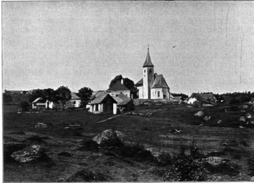
Fig. 221 Alt-Melon, Gesamtansicht von Südosten (S. 255)