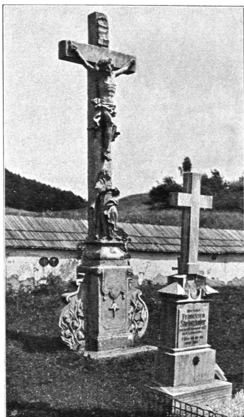
Fig. 200 Groß-Gerungs, Friedhof, Kruzifix (S. 232)