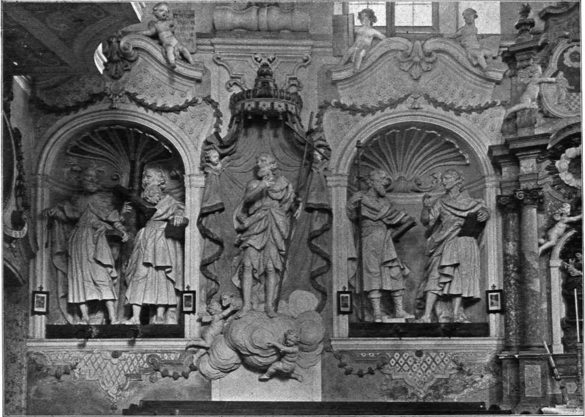
Fig. 162 Schwarzenau, Schloß, Kapelle, Ostwand (S. 195)