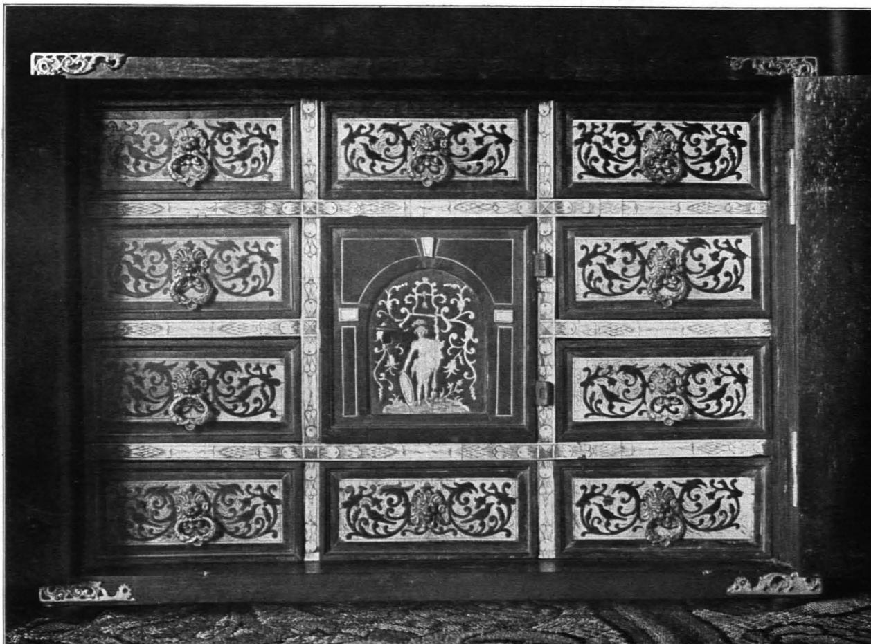
Fig. 107 Italienisches Kästchen, Ebenholz und Elfenbein, XVII. Jh. (S. 136)

8. Eisenkästchen ( 10 \times 20 \times 10 ), mit Silberätzung verziert, Landsknecht und Frau, zwei Kriegerköpfe, Ornamente; kunstvolles altes Schloß. Deutsche Arbeit aus der zweiten Hälfte des XVI. Jhs. (Kaiserzimmer).