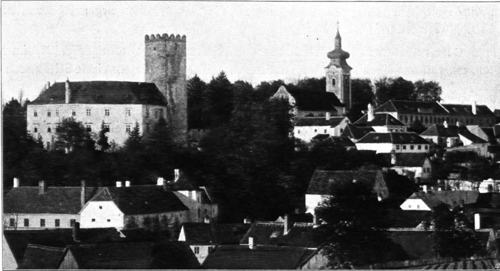
Fig. 9 Allentsteig, Ansicht von Schloß und Kirche im Jahre 1901 (S. 1)

an Paris von Sonderndorf, der 1599 von Veit Sigmund Hager auch das dritte Drittel erwarb. Sigmund Hager starb 1610 im Alter von 85 Jahren. Wie sein Vater Sebastian, der bei Pavia, gegen Zapolya, bei der Verteidigung Wiens gegen die Türken (1529), in Italien, Ungarn und Deutschland gegen Franzosen, Türken und