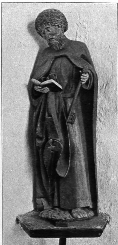
Fig. 384 Waldhausen, Pfarrkirche, Apostel Petrus (S. 417)