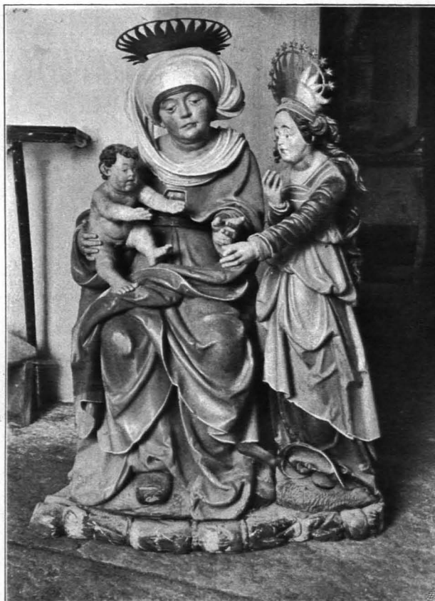
Fig. 382 Waldhausen, Pfarrkirche, Anna Selbdritt (S. 417)

Anbauten. A n b a u t e n: 1. Niedriger Vorbau mit Pultdach im Winkel südlich neben dem Turme. Modern. 2. Sakristei. Nördlich neben dem Chore, eingeschossig. — O. Rechteckige Tür, daneben kleines rechteckiges Fenster. — N. Kleine rechteckige Luke. — Ziegelpultdach in Fortsetzung des Chordaches.