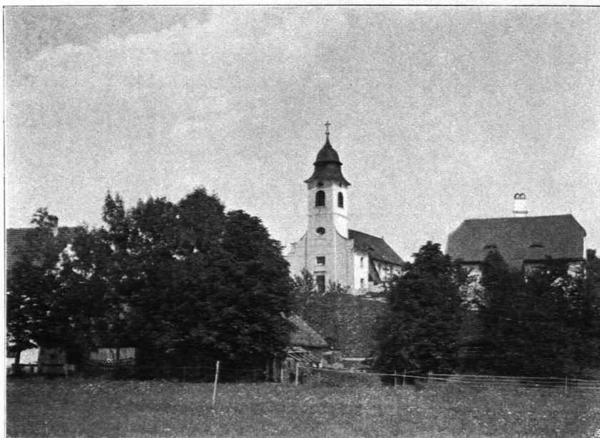
Fig. 379 Ober-Strahlbach, Pfarrkirche und Pfarrhaus von Südwesten (S. 412)

infolge eines Schreibfehlers irrtümlich „Scelebaes“ genannte Ort mit Strahlbach identisch („Scelebaes daz ist daz Stralbach und das Erlech“) (Fontes 2, III 32, 34, 35). In der Bestätigungsurkunde des Papstes Innozenz II. von 1139 wird der Ort „Starlbach“ genannt, in jener des Papstes Alexander III. von 1179 schon „Stralbach“ (l. c. 37, 61). Schon damals bestanden Ober- und Unter-Strahlbach (Stralbach ambo, superius et inferius, l. c. 70, 93). Der Ort Ober-Strahlbach verdankt seine Entstehung dem Pilgrim von Kuenring, Pfarrer der Stadt Zwettl, der hier den Wald ausroden und das Dorf erbauen ließ (um 1150) (l. c. 47). Hadmar III. und Heinrich I., die „Hunde“ von Kuenring, bemächtigten sich bei ihrer Empörung gegen den Herzog Friedrich II. der Güter Moidrams, Strahlbach und Gerlas (l. c. 135). Beim Begräbnisse ihres Vaters Heinrich I. restituierten dessen Söhne dem Stifte das Gut Ober-Strahlbach (l. c. 135). Ihre Schwester Eufemia von Pottendorf erhob dagegen zwar Einspruch, schloß aber doch 1256 einen Vergleich mit dem Stifte, wonach sie ein Drittel des Gutes behielt (l. c. 137); 1276 verpfändete sie für ein Darlehen dem Abte Ebro ihre Güter zu Strahlbach, Jagenbach, Waldhams, nahm sie jedoch bald wieder zurück (l. c. 148, 149). — Das Zwettler Rentenbuch (um 1320) vermerkt in Ober-Strahlbach 38 Lehen (l. c. 502). 1342 erhielt das Stift hierüber von Rudolf von Liechtenstein die Dorffreiheit.