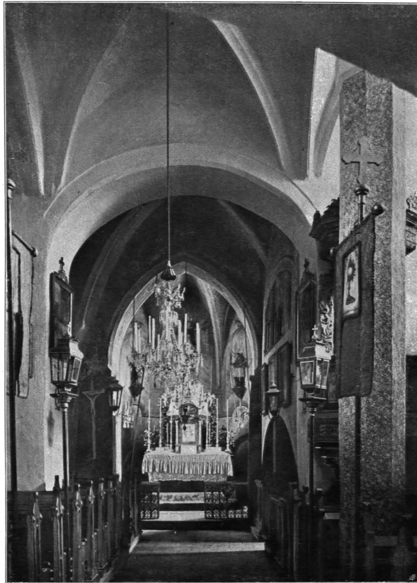
Fig. 348 Riegers, Pfarrkirche, Inneres, gegen Osten (Chor) (S. 375)

2. Seitenaltar. Holz, polychromiert. Modern, pseudogotisch, mit zwei spätbarocken, neu polychromierten