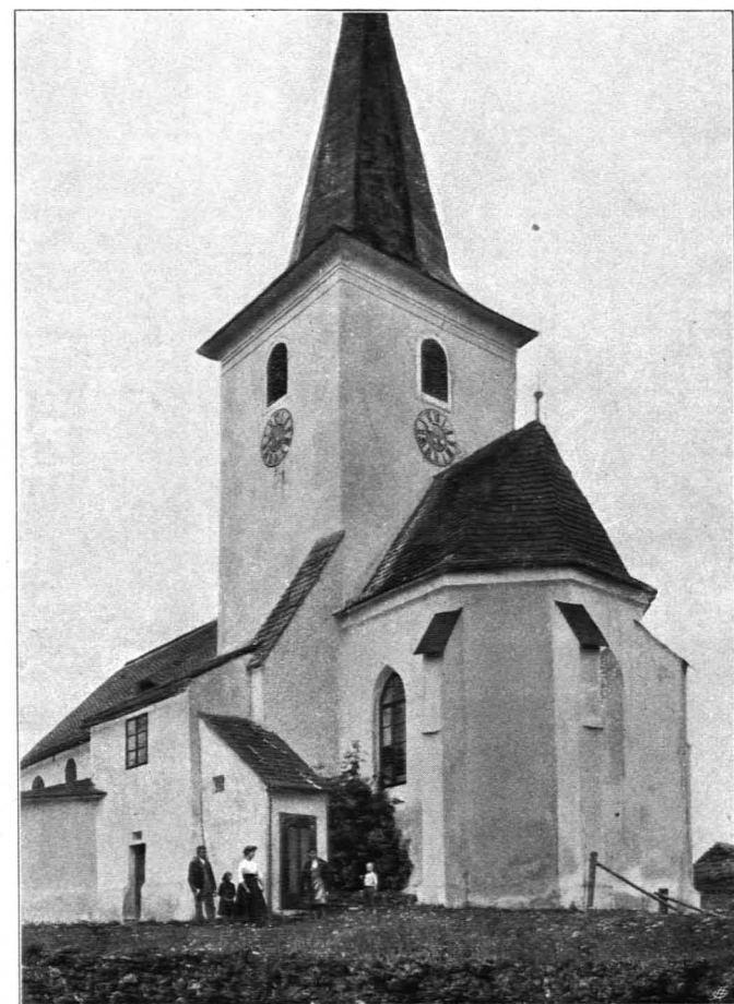
Fig. 347 Riegers, Pfarrkirche, von Südosten (S. 373)

T u r m : Der untere Teil bildet eine (in gleicher Höhe wie das Langhaus) kreuzgewölbte, mit Rokokomustern ausgemalte Vierungshalle; die beiderseits gekahlten Rippen verschneiden sich in einem runden Schlußstein und verlaufen im N. in den vortretenden Gewölbezwickeln. An der Südseite ist (ein Stück des Gewölbes abschneidend) die vorgeschobene Mauer der Empore eingebaut; sie ruht auf einem breiten Rundbogen. Darunter die alte gotische Sakristeitür in einfacher Steinrahmung mit flachem