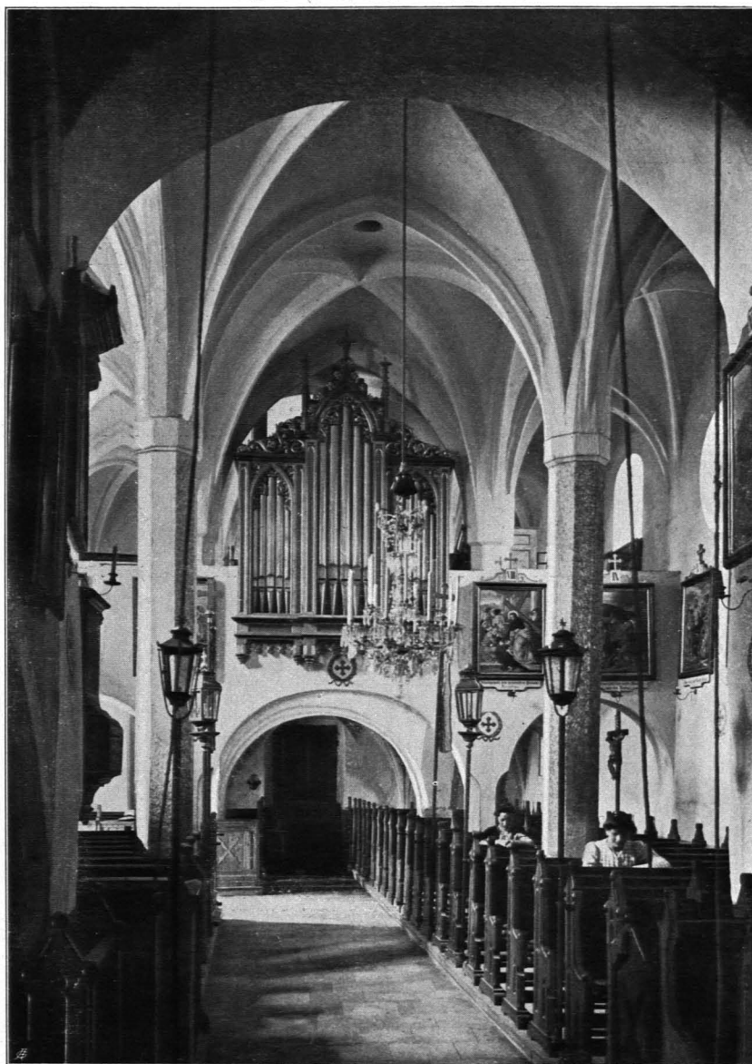
Fig. 349 Riegers, Pfarrkirche, Inneres, gegen Westen (Musikempore) (S. 375)

4. Am Dachboden Bruchstücke zweier weiß lackierter Holzstatuen, St. Johann und St. Rochus. Mitte des XVIII. Jhs.