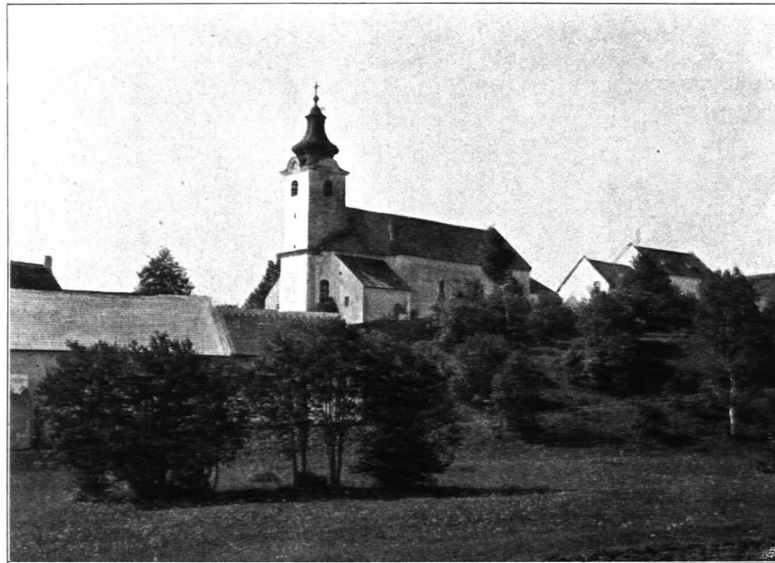
Fig. 340 Oberndorf, Pfarrkirche, Ansicht von Nordosten (S. 367)