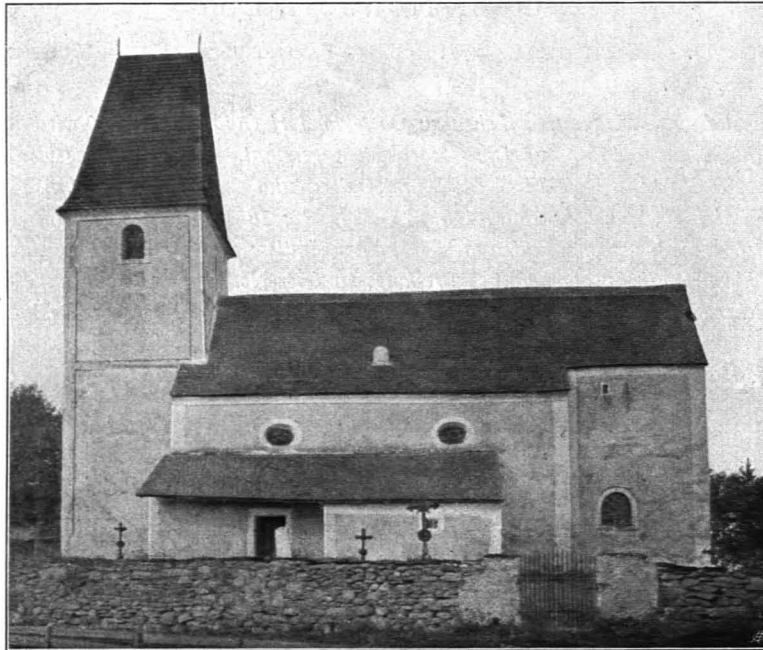
Fig. 338 Ober-Nondorf, Filialkirche, Südansicht (S. 363)