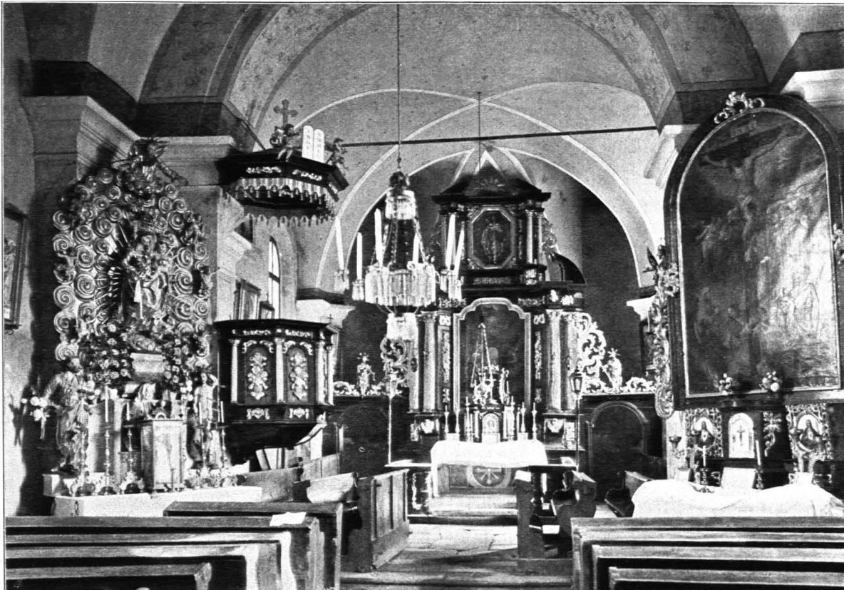
Fig. 331 Marbach am Walde, Pfarrkirche, Inneres gegen Osten (S. 354)

Chor: In gleicher Höhe und nur wenig einspringend im O. an das Langhaus angebaut. Rechteckig mit dreiseitigem Abschlusse. Umlaufender Sockel mit Steingesims. An der Südseite und an den Ecken fünf wenig vortretende rechteckige Strebpfeiler mit Steinpult- und Giebeldachung, in der Mitte geteilt durch ein profiliertes Gesims, mit eigenartiger Ecklösung bei den beiden südlichen Strebpfeilern. Im S. großes rundbogiges Fenster in Nische mit abgeschrägter Laibung, im O. querovales Fenster, im N. großes rundbogiges Fenster, daneben Sakristeianbau. Über Langhaus und Chor gemeinsames, nach O. abgewalmtes Ziegelsatteldach.