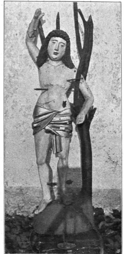
Fig. 328 Schwarzenbach, Kapelle, St. Sebastian (S. 350)

Kapelle: 1857 erbaut. Rechteckig, halbrunder Abschluß, Giebelreiter. Moderne Einrichtung.