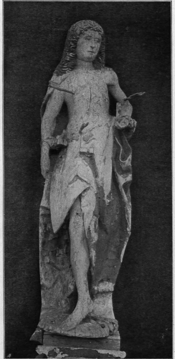
Fig. 320 Jagenbach, Pfarrkirche, gotische Statue des hl. Sebastian (S. 340)