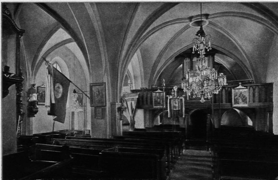
Fig. 311 Groß-Göttfritz, Pfarrkirche, Inneres, Blick vom Chore zur Musikempore (gegen Westen) (S. 332)

Gitter. — S. Gotische Sessionsnische (Priestersitzbank), gebildet aus zwei spitzbogigen Nischen in Steinfassung mit Kleeblattbogenabschluß; gotische Sakristeitür in Steinrahmung mit flachem Kleeblattbogen. Im Abschlusse im N. und S. je ein Spitzbogenfenster, im O. oben ein Rundfenster. Oblonges Kreuzrippengewölbejoch und normales Abschlusrippengewölbe mit fünf tiefen radialen Stichkappen. Die beiderseits gekehrten, in runden Schlußsteinen sich schneidenden Rippen ruhen auf halbrunden Diensten auf, die in einem um den ganzen Chor umlaufenden Kaffgesimse endigen.