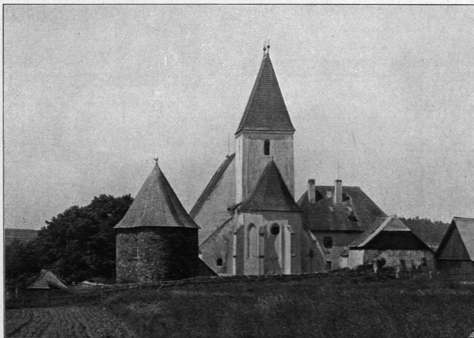
Fig. 309 Groß-Göttfritz, Pfarrkirche, Karner und Pfarrhaus, Ansicht von Osten (S. 331)

Könnte man daraus, daß das Langhaus flach gedeckt war und der Turm damit gleichzeitig entstand, schließen, daß die ursprüngliche Anlage eine romanische war — ist doch der Ostturm ein Charakteristikon der romanischen Landkirchen im Waldviertel, vergleiche Groß-Globnitz, Rappottenstein, Oberkirchen, Sallingstadt, Kirchberg a. d. Wild, Alt-Pölla, Gerungs, Rieggers, Schweiggers — so widerspricht dem, daß auch der sicher gotische Chor zur ursprünglichen Anlage gehört. Dies geht aus folgendem hervor: 1. Die Gesimsprofile des Chores und des Turmes an der äußeren Nordseite sind aus einem Guß. 2. Die mit Zuhilfenahme eines das Gewölbe durchlassenden Entlastungsbogens über dem östlichen Quergurte der Turmhalle sich erhebende Ostmauer des Turmes zeigt am Dachraume über dem Chorgewölbe an ihrer (äußeren) Ostseite keine Spur von Abwitterung der Steine oder Verputz; dieser Teil war also immer schon durch das Chordach geschützt gewesen, der Turm ist im O. in seiner unteren Hälfte nie frei gestanden, was der Fall sein müßte, wenn er romanisch wäre.