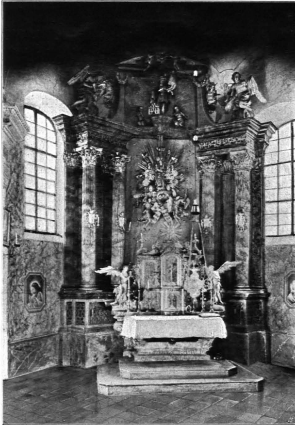
Fig. 152 Scheideldorf, Pfarrkirche, Hochaltar (S. 181)

Hinter der Mensa, durch einen Umgang getrennt, reicher Wand Aufbau: Schräg beiderseits der blau gefärbelten Mittelwand stehen auf mannshohem, zweigeteiltem Sockel, dessen oberer Teil mit Reliefs (Anbetung der Hirten und der Magier, versilbert auf rotem Grunde) verziert ist, je zwei hohe kannelierte korinthische Säulen mit vergoldeten Basen und Kapitälern vor ähnlichen Doppelpilastern. Darüber kräftig profiliertes verkröpftes Gebälk mit einem Fries von versilberten Ornamenten auf rotem Grunde. Stein mit grau marmorierter Stuckbekleidung. Oben je ein anbetender Engel, Holz, vergoldet und polychromiert. An der blau bemalten, mit silbernen Sternen besetzten Mittelwand Gruppe der Madonna mit dem Kinde, im Strahlenkranze auf Wolken mit elf Cherubsköpfchen, von zwei Leuchterengeln getragen. Holz, polychromiert, vergoldet