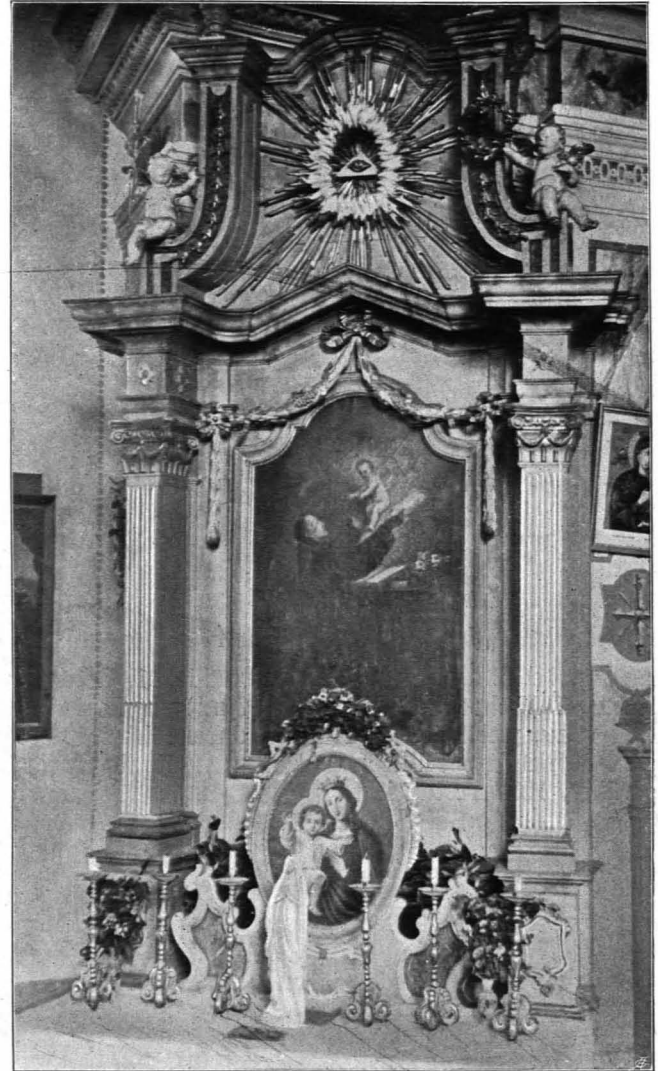
Fig. 153 Scheideldorf, Pfarrkirche, Seitenaltar (S. 182)

und (Wolken) versilbert. Darüber Giebelaufsatz (Stein und Stuck) mit der polychromierten Holzstatue des hl. Florian, vier Putten und Kreuz. Der Altar, aus dem aufgehobenen Kloster Eggenburg stammend, gehört der ersten Hälfte des XVIII. Jhs. an.