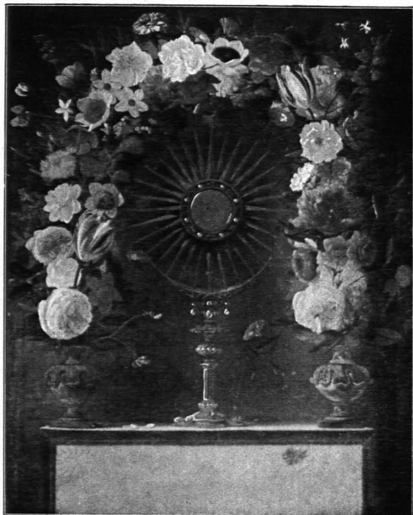
Fig. 154 Scheideldorf, Pfarrkirche, Blumenstück von Johann Anton van der Baren (S. 183)

Gemälde: 1. Chor, Nordwand. Großes Bild, Öl auf Leinwand, Darbringung Jesu im Tempel, reich an Figuren, im Hintergrunde perspektivische Hallenarchitektur. Mittelmäßige Arbeit. Zweite Hälfte des XVIII. Jhs. Gemälde.