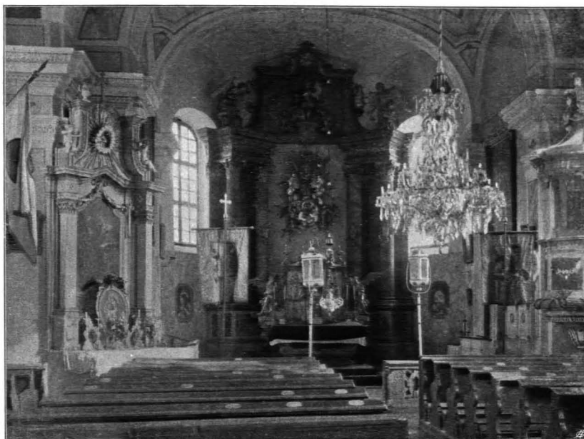
Fig. 150 Scheideldorf, Pfarrkirche, Inneres, Chor (S. 181)

brochen sind. Die Decke besteht aus drei oblongen Platzlgewölben, die zwischen die Rundbögen der Langwände und große auf den Wandpfeilern aufsitzende Flachbogen eingespannt sind, welche eine entsprechende Gliederung in zwei Gurten aufweisen. — Westempore (Fig. 151): In der Breite des Schiffes, auf zwei freistehenden quadratischen und zwei Wandpfeilern ruhend, die durch Flachbogen verbunden sind. Drei untergespannte Platzlgewölbe. Der südliche Teil durch Stiegenaufgang verbaut (mit Tür im O.).