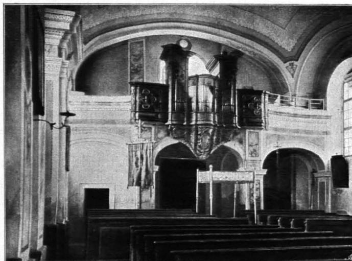
Fig. 151 Scheideldorf, Pfarrkirche, Inneres, Musikempore (S. 181)

Langhaus: Rechteckiger Saal. Jede Langwand in drei Teile geteilt durch je zwei rechteckig vortretende massive Wandpfeiler und entsprechende Eckpfeiler, die ein kräftig profiliertes vorkragendes Kranzgesims tragen. Jeder Wandpfeiler ist gegliedert durch zwei vorgelegte Flachpilaster mit Kämpfern. Durch verbindende Rundbogen entstehen jederseits drei flache Nischenräume, die von großen Flachbogenfenstern durch-