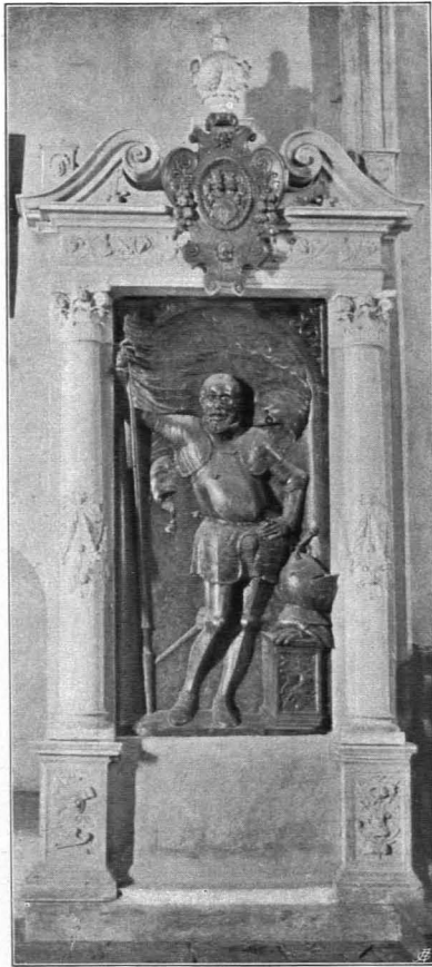
Fig. 664 Thunau, Pfarrkirche, Grabmonument im Chor (S. 542)