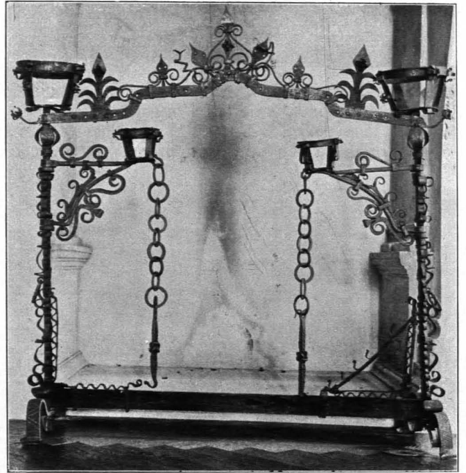
Fig. 621 Schloß Rosenberg, -Feuerhund (S. 513)