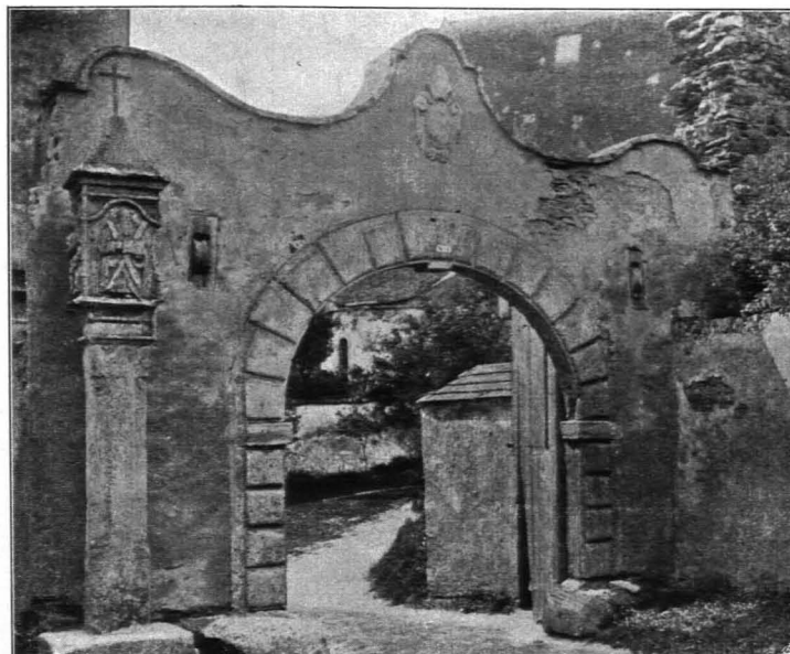
Fig. 532 Pernegg, Hauptportal des Klosterkomplexes (S. 460)

Bruchsteinbau; es stehen Reste der Nord-, Süd- und Westseite des Langhauses mit Spuren von Verputz. Gegen O. modern eingezogene Mauer mit Tür und Fenster zu der als Lourdesgrotte eingerichteten, niedrigeren, halbrunden Apsis. Gegen außen ist der ursprüngliche Sockel noch kenntlich. Im S. Rundfenster mit eingeblenndetem Vierpaß. Die Kapellenruine ist malerisch mitten im Walde zwischen dem geringen Schutt des einstigen Schlosses gelegen.