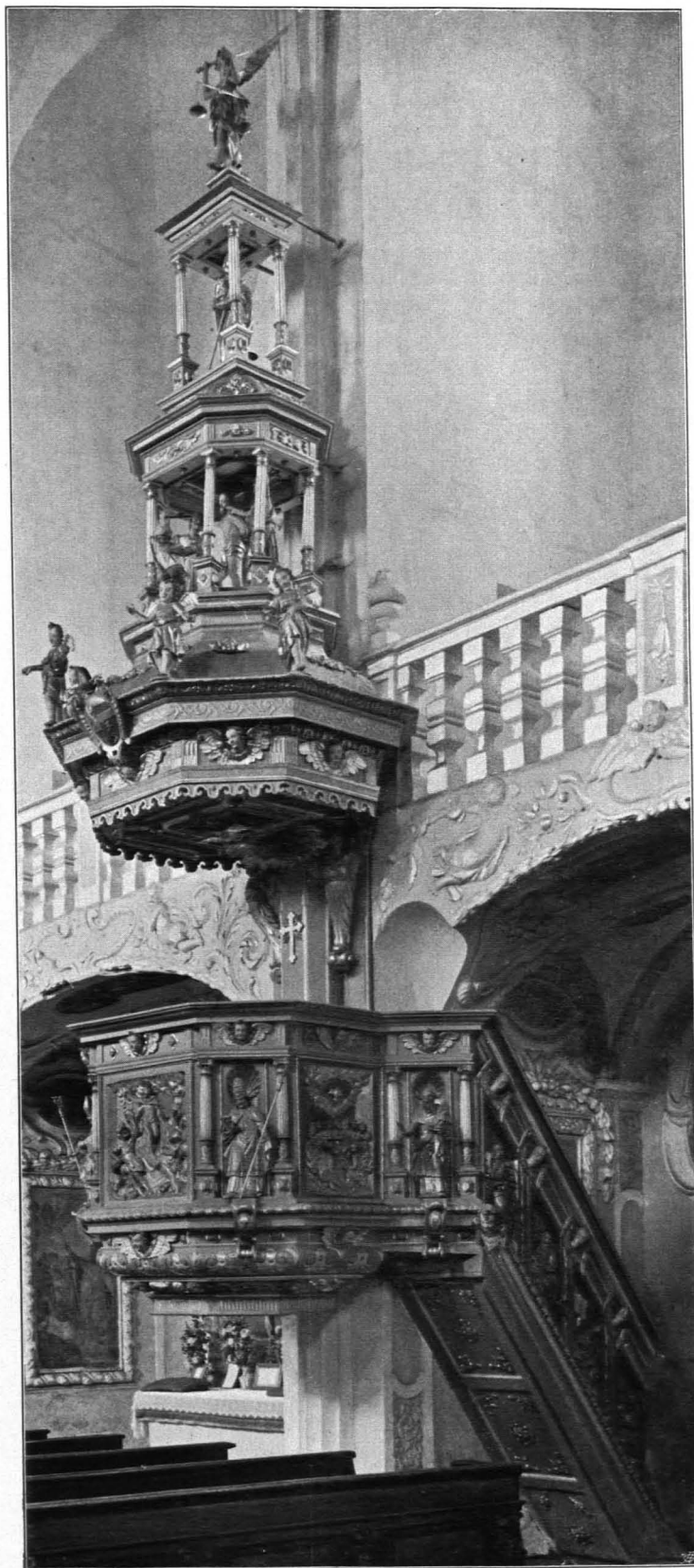
Fig. 525 Pernegg, Pfarrkirche, Kanzel (S. 453)

mit gebrochenem Segmentgiebel. Im Giebelfelde vierpaßförmiges Aufsatzbild — Auge Gottes in Glorie — in freigeschnitztem Riemenwerkrahmen. Davor das Hauptgebälk überschneidend Kartusche mit Namenszug Mariae. Seitlich angesetztes Riemenwerk und zwei unterlebensgroße Statuen von Erzengeln. Altarbild: Hl. Schutzengel. Ende des XVII. Jhs. (Fig. 523).