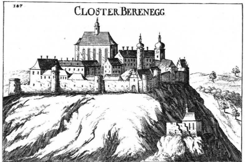
Fig. 511 Pernegg, Ansicht des Klosterkomplexes nach der Radierung von G. M. Vischer von 1672 (S. 442)

Kapelle: Weiß verputzt, mit kleinen, seitlichen Segmentbogenfenstern, abgerundeter Apsis mit zwei kleineren ebensolchen Fenstern und hölzernem Dachreiter mit Zwiebdach über dem Schindelsatteldach. (Seit 1910 mit angebautem, gemauertem Turm mit blechgedecktem Pyramidendach, die umgebaute Kapelle mit Eternit gedeckt.) Das Innere tonnengewölbt, mit einspringenden Zwickeln, die einander im Scheitel berühren; einspringende abgerundete Apsis. Einrichtung modern. Skulptur: polychromierte Holzstatuette einer hl. Matrone, Ende des XV. Jhs.