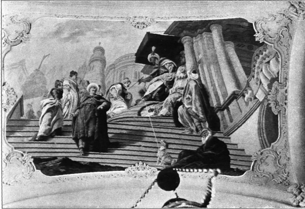
Fig. 496 Dreieichen, Pfarrkirche, Deckenfresko von J. Hauzinger im Chor (S. 430)

Die Seitenemporen ruhen auf einem Tonnengewölbe, das mit Stichkappen und von Gurten — Richtung O.—W. — eingefasst ist; die Gurten gehen in Pilaster über. Die Brüstungsmauern glatt. Die obere Emporen von Pilastern eingefasst, vom Kranzgesimse ganz umlaufen, sonst wie die Mittelkapellen. An