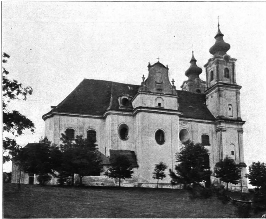
Fig. 490 Dreieichen, Pfarrkirche, Nordseite (S. 426)

überfließend versehen (Dekanatsarchiv Raabs). 1783 wurde D. eine selbständige Pfarre. 1819 wurden die beiden Türme in einer etwas einfacheren Form, als sie ursprünglich geplant gewesen waren, gebaut;