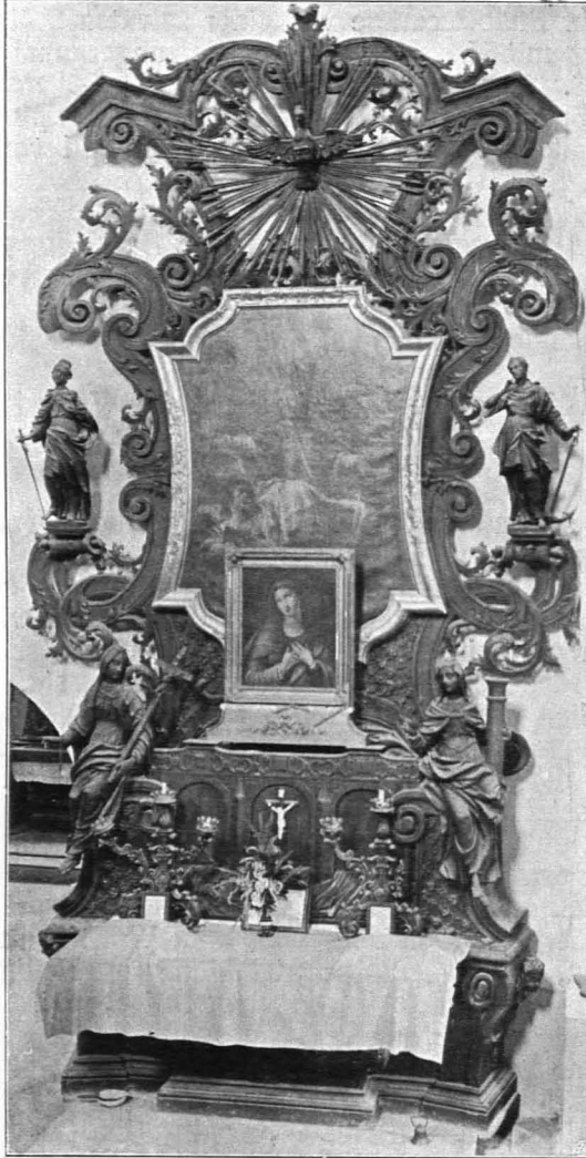
Fig. 422 Johannes-Nepomuk-Altar (S. 367)

3. Seitenaltar, im N. der Kapelle. Bild- und Skulpturenaufbau aus schwarzem Holze mit Vergoldung, die figuralen Teile polychromiert und vergoldet. Staffel mit seitlich je zwei vorspringenden Postamenten; auf diesen eine vortretende, äußere und zurückstehende, innere Säule, beide über hohen, mit spitzem Blattwerke besetzten Trommeln, gedreht, mit reichgeschnitzten Kapitälern und kurzen, mit Blattappliken besetzten Kämpfern; am Aufbau hinter ihnen sind reichgeschnitzte Blattranken appliziert. Über den Kämpfern Trümmer eines geschwungenen und eines Segmentgiebels. Das Mittelbild rundbogig abgeschlossen, der Rahmen aus durchbrochenem Rankenwerke bestehend. Der Aufbau setzt sich fort und schließt gerade ab. In der Mitte auf dem Abschlusse Konsole, daran die Taube in Glorie appliziert; darauf Gott-Vater mit Szepter und Weltkugel thronend, seitlich zwei kleine und zwei große Engel; zwei weitere, adorierende auf dem Säulengebälke. Über Volutenkonsolen mit applizierten Fruchtbuketts stehen zwischen den Säulen