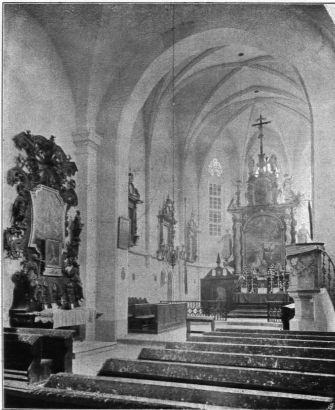
Fig. 421 Horn, Pfarrkirche, Inneres (S. 366)