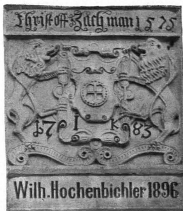
Fig. 412 Gars, Wappenrelief am Hause Nr. 62 (S. 359)

Haus Nr. 62 (Mühle am Kamp): In profilierter Rahmung Reliefwappen; von Löwen flankierte Rollwerkkartusche mit Mühlrad. Oben Aufschrift: Christoff Zachmann 1575 . Im Relief: I. K. 1783 ; darunter Wilhelm Hochenbichler 1896 (Fig. 412).