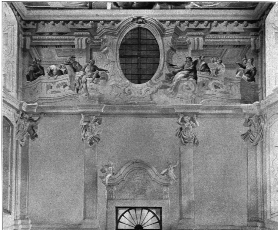
Fig. 350 Altenburg, Stift, Schmalwand im Bibliotheksstiegenhaus (S. 313)