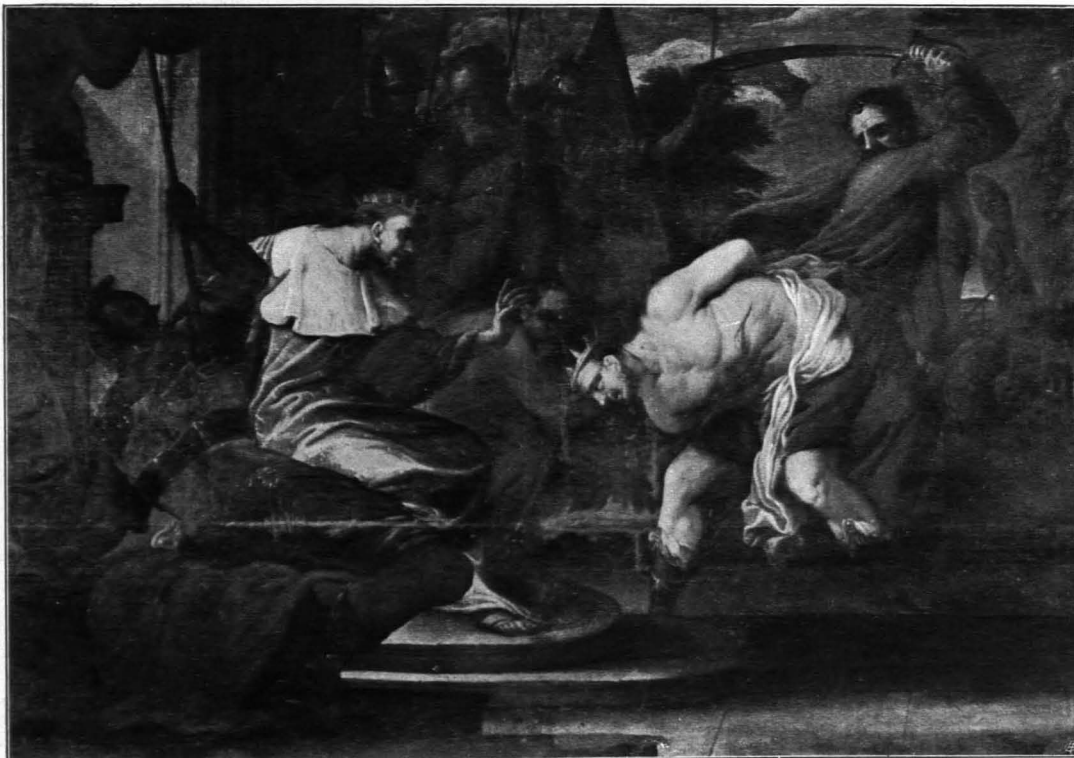
Fig. 328 Altenburg, Stift, Alttestamentarische Szene (S. 299)