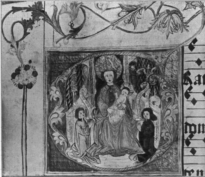
Fig. 248 Geras, Bibliothek, Antiphonar, f. 207 (S. 215)