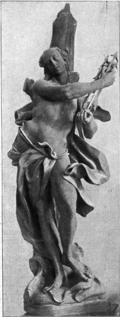
Fig. 213 Geras, Stiftskirche, Norberti- kapelle, Hl. Sebastian (S. 189)

2. und 3. Seitenaltäre; schräg an den östlichen Pfeilern, Bildaufbau aus Holz, grünlichgelb marmoriert; die figuralen Teile weiß gefaßt, mit Vergoldung. Hinter der schmalen, nach vorn gebauchten Mensa der Aufbau, das kartuscheförmige, hohe Bild enthaltend, nach oben mit geschwungenem Volutensturze, nach den Seiten mit perspektivisch gestellten nach oben unten eingerollten Volutenbändern mit Tressen- und Blätterbehang endend. Putten, Cherubsköpfchen und Bandornament, als Bekrönung ein Kreuz und Flammenherzen mit einem Putto daneben, auf den unteren Voluten große Engel. Altarbilder (im S.) die hl. Jungfrau von Engeln umgeben,