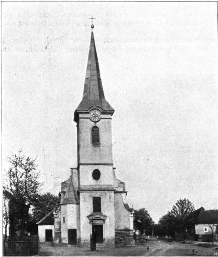
Fig. 130 Stoitzendorf, Pfarrkirche (S. 124)

Beilagen VIII 497). 1500 erhielt sie einen Ablass von 100 Tagen. 1564 wurde darin noch Gottesdienst gehalten (Geschichtl. Beilagen VIII 513). Im Laufe des XVI. Jhs. dürfte die Kirche, die inzwischen dem hl. Leopold geweiht worden war, zugrunde gegangen sein. 1613 wurde eine neue Kirche konsekriert;