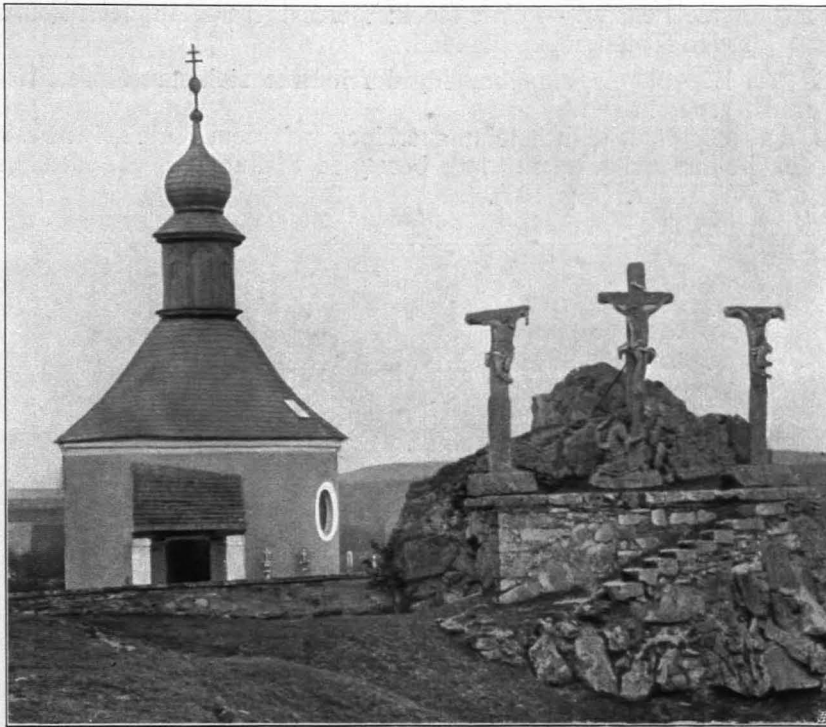
Fig. 103 Kühnring, Karner und Kalvarienberg (S. 93)