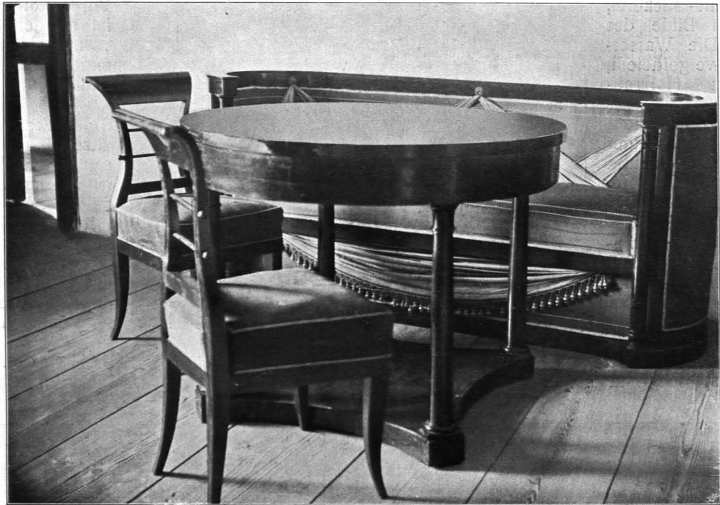
Fig. 192 Drosendorf, Schloß, Empiregarnitur (S. 175)

fenster in großen Abständen stehen. An der einen (Haupt-)Breitseite schwach betonter Mittelrisalit, darin Portal, rechteckig, von nach unten zulaufenden Pilastern eingefäßt, über deren Deckplatten das Gebälk aufliegt; darauf gebrochener, geschweifeter Sturz, mit drei bekrönenden Kugeln über Sockeln. Im Giebfelde skulptierte Muschel zwischen Band- und Rankenornament. Über den Schmalseiten Volutengiebelaufsatz über stark vorspringenden Gesimsen, durch ein Simsband in zwei Geschosse geteilt, im unteren zwei, im oberen ein steilovales Fenster in Rahmung mit vier Keilsteinen; zwischen den zwei unteren Fenstern Rundbogennische mit Skulptur der Immakulata beziehungsweise eines betenden Kriegers. Über den Giebelvoluten aufgesetzte Kugel, über den Ecken der gebrochenen Schenkel Pyramiden, über dem Scheitel Pinienzapfen, alle über Sockeln. Ziegelsatteldach mit zwei Langreihen von Dachfenstern. Die einzelnen Schüttboden durch geschnitzte Holzsäulen gestützt. Um 1710.