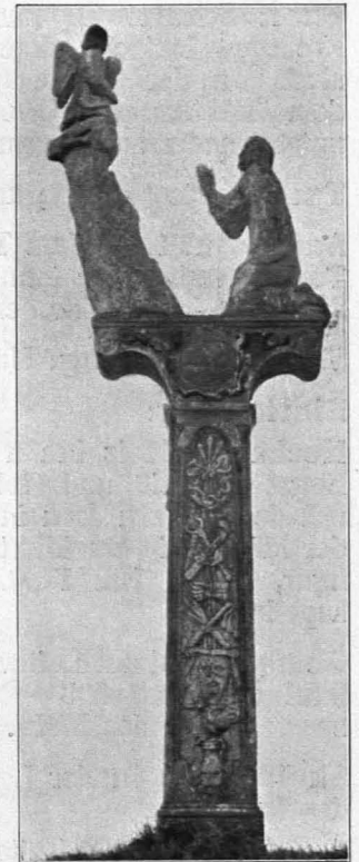
Fig. 108 Sigmundsherberg, Bildstock (S. 98)