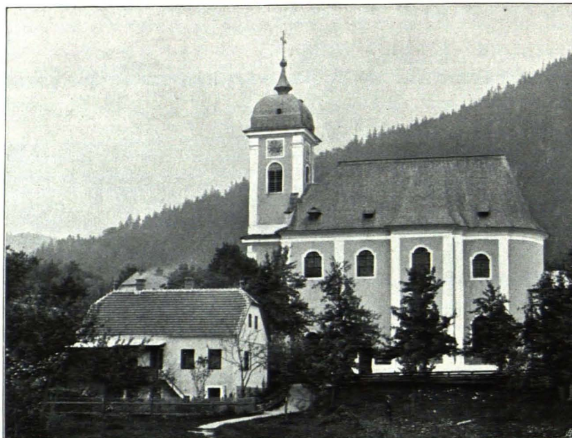
Fig. 295 Pisching, Pfarrkirche (S. 249)

Kirchentür mit geradem Sturze an der Westseite; zweites Geschoß mit Ortsteineinfassung; ovales Fenster im W., darüber noch stärkeres Gesims mit Blechrampe; drittes Geschoß mit Eckpilastern eingefasst, mit vier großen rundbogigen Schallfenstern; darüber rechteckiges Zifferblatt, Kranzgesims, vierseitiges ausgebauchtes Blechzelddach mit Kugel und Kreuz (1840 anstatt des hölzernen Turmes um 5200 fl. erbaut).