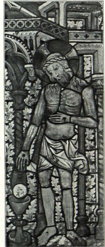
Fig. 284 Weiten, Pfarrkirche, Scheibe 61 (S. 230)

XIV. Jhs. an, so 19, 30, 33, 34, 41, 42, 43. Um 1500 entstanden 23, 44, 61, während einzelne Wappenscheiben noch jünger sind. Vgl. auch Übersicht.