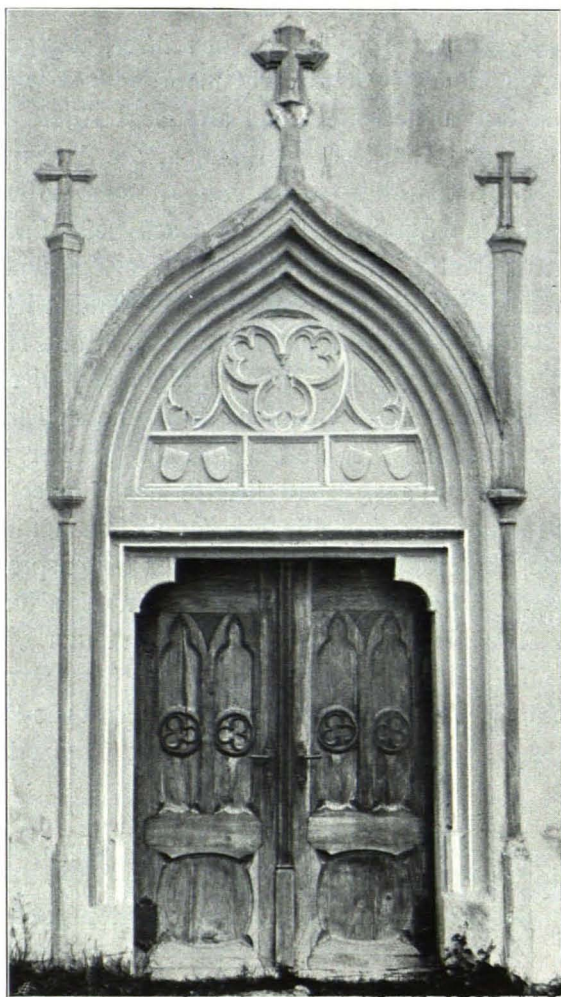
Fig. 231 Westportal (S. 211)

Chor. Gleich hoch wie das Langhaus, aber etwas schmaler; breiter, umlaufender Sockel. S. Zwei Strebepfeiler mit Sockel und einem Wasserschlage und über schwacher Abstufung Abschluß durch Steingiebel und Pultdach. Dazwischen zwei sehr hohe, schmale Spitzbogenfenster mit verstärkter Laibung. — O. Ab-