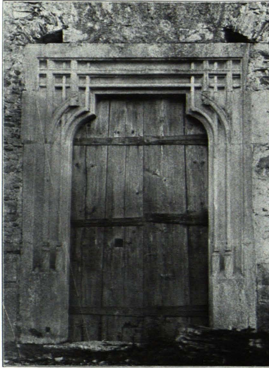
Fig. 203 Pöggstall, Annakirche, Portal (S. 180)

(6 × 2); Auszug der drei hl. Könige; diese zu Pferde, mit großem Gefolge; links eine große Festung (Jerusalem[?]) mit überragendem Wartturm, auf dem ein das Horn blasender Wächter steht. Sehr schadhaft; Ende des XIV. Jhs. (Durch Herrn Ingenieur Rudolf Pichler freigelegt.) Im S. drei dreiteilige und ein zweiteiliges, im W. und N. je ein zweiteiliges Spitzbogenfenster, das Maßwerk zum Teil erhalten. Im N. und S. je eine Tür mit flachem Kleeblattbogenabschluss in Segmentbogen-nische.