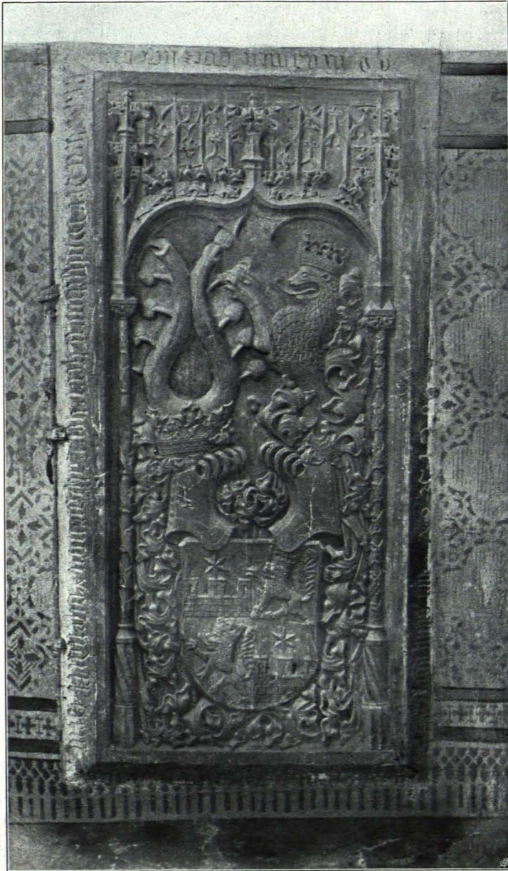
Fig. 194 Pöggstall, Pfarrkirche, Grabstein des Kaspar von Rogendorf (S. 176)

Innen, im S.: 11. Roter Marmor mit Relief. Das Feld von zwei seitlichen Säulchen über gedrehten Sockeln, mit Blattgewinde eingefaßt, auf denen lange verzierte Fialen