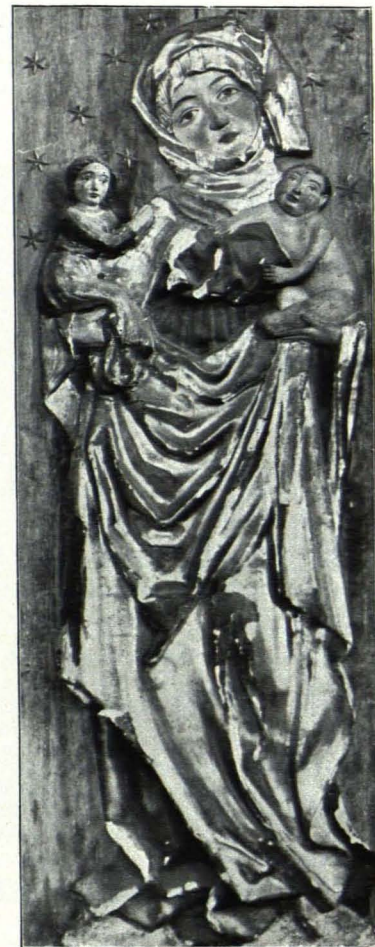
Fig. 184 Pöggstall, Pfarrkirche, Relief vom Marienaltar (S. 171)

schwarz, zum Teil vergoldet. Das rundbogig geschlossene Bild von Säulen und kleinen Fialen flankiert, über den Säulen ein den Aufbau abschließender Kielbogen mit eingblendetem Maßwerke, Krabben und Kreuzblume. Altarbilder (nördlich): Enthauptung der hl. Barbara; (südlich): Krönung Mariens. Von Georg Srna, 1847. Tabernakel; quadratisch, mit übereck gestellten Fialen an den vorderen Kanten und Kielbogen mit Kreuzblume an der Seite; die Tür mit vergoldetem Vierpaßfüllmuster; als Bekrönung des südlichen mehrfach gestufter Sockel, der die Statuette eines Heiligen trägt (s. Übersicht). Die an der Stelle dieser Altäre befindlichen gotischen Altäre der Fränkischen Schule, die FREIHERR VON SACKEN noch im Schlosse gesehen und beschrieben hat, sind nicht mehr vorhanden. Sie kamen in die Kunstsammlungen des Allerhöchsten Kaiserhauses und sind gegenwärtig im Schlosse Ambras aufgestellt.