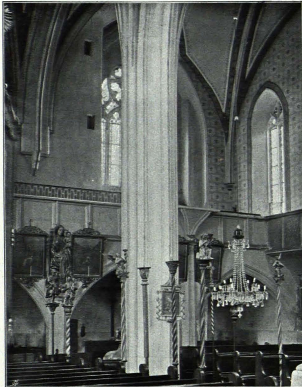
Fig. 174 Pöggstall, Pfarrkirche, Inneres (S. 167)