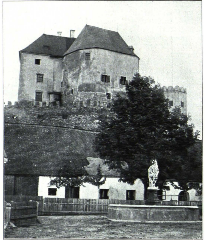
Fig. 12 Albrechtsberg, Schloß, vorn Florianstatue (S. 8)

Beschreibung. Beschreibung: Das stattliche Schloßgebäude auf einer nach allen Seiten steil abfallenden Anhöhe gelegen, bildet zusammen mit der Pfarrkirche, mit der es ein Gang verbindet, einen weithin sichtbaren Komplex. Im wesentlichen erhielt das Schloß seine jetzige Form im XVI. Jh. mit Benutzung älterer Teile (Fig. 12).