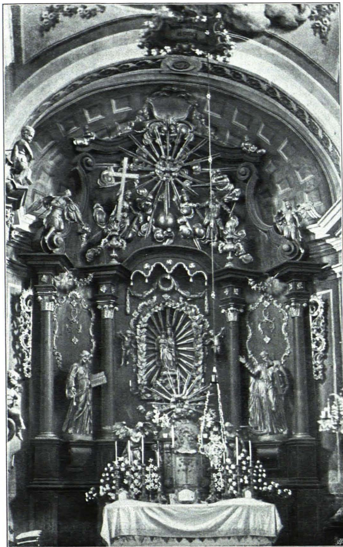
Fig. 8 Albrechtsberg, Pfarrkirche, Hochaltar (S. 4)

Hälfte des XV. Jhs. Tabernakel, auf der Mensa freistehend, reichgeschnitzt und vergoldet. Der von Steilvoluten eingefäßte Mittelbau in seitliche Voluten übergehend, auf deren Enden große adorierende Engel knien. Zugehörig acht geschnitzte und vergoldete Rocailleleuchter und drei ebensolche Kanontafeln. 1779 von A. Carcon in Krems vollendet (s. oben).