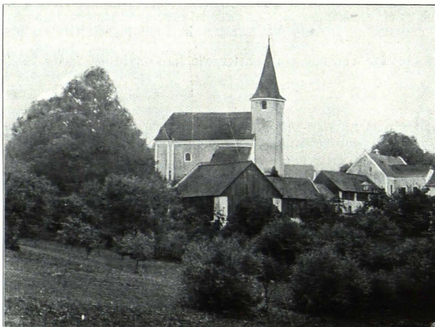
Fig. 220 Groß-Reinprechts, Pfarrkirche (S. 199)

Ruine. Ruine: Auf steiler Anhöhe am linken Ufer der großen Krems südöstlich vom Dorfe gelegen. Spärliche Reste einer Burg von kleinem Umfange mit Turm, Grundmauern und Gerölle. Vom Volke das öde Schloß genannt und mit Geisterspuk bevölkert.