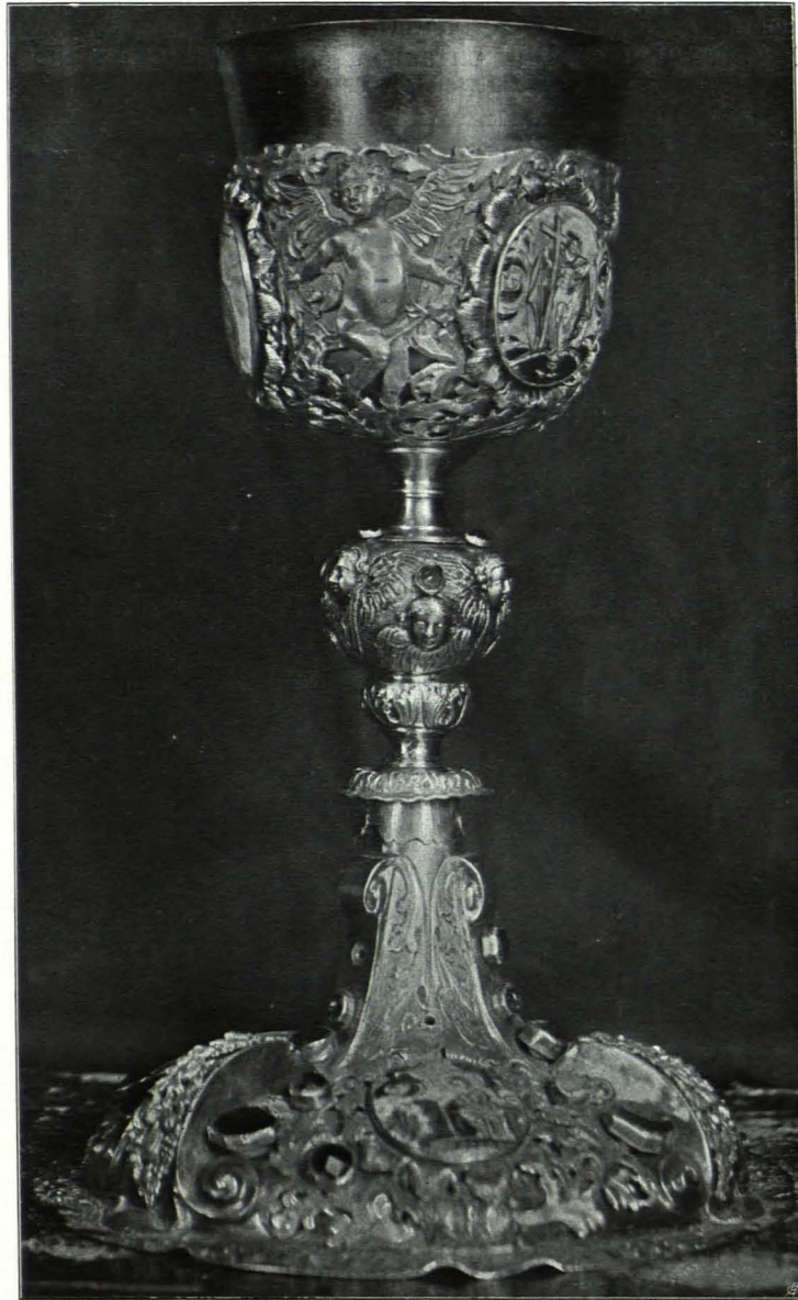
Fig. 222 Groß-Reinprechts, Pfarrkirche, Kelch (S. 202)