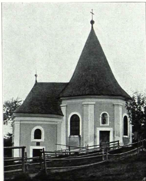
Fig. 135 Grainbrunn, Brünndlkapelle mit Anbau (S. 130)

Chor: Niedriger und schmaler als das Langhaus, um eine Stufe erhöht. Ungegliederter Scheidebogen. Die Wände sind durch leicht vortretende Pilaster mit Simsplatte gegliedert. Die Decke besteht aus zwei gratigen Kreuzgewölben und Abschlußgewölbe gegen O. Im N. und S. je eine rechteckige Tür und zwei Fenster wie im Langhause.