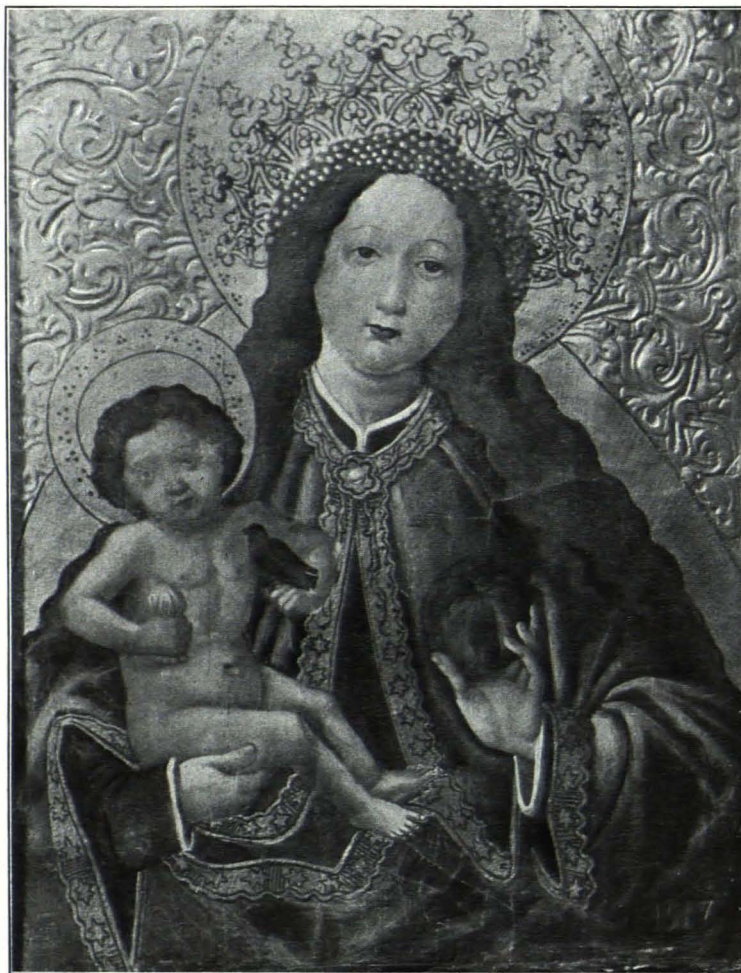
Fig. 136 Grainbrunn, Brünndlkapelle, Gemälde (S. 130)

Weihwasserbehälter. Weihwasserbehälter: Messingkessel mit umlaufender Bordüre aus Seeungeheuern und Pflanzenranken; um 1840.