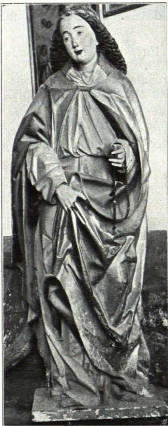
Fig. 91 Heiligenblut, Ursprungskapelle, Holzskulptur (S. 81)

Östlich von der Pfarrkirche auf dem hohen Hausegg oder Hohegg genannten Berge gelegen, Grundmauern aus Bruchstein, Gewölbe und Schutt sind die einzigen Überreste des ehemaligen Baues.