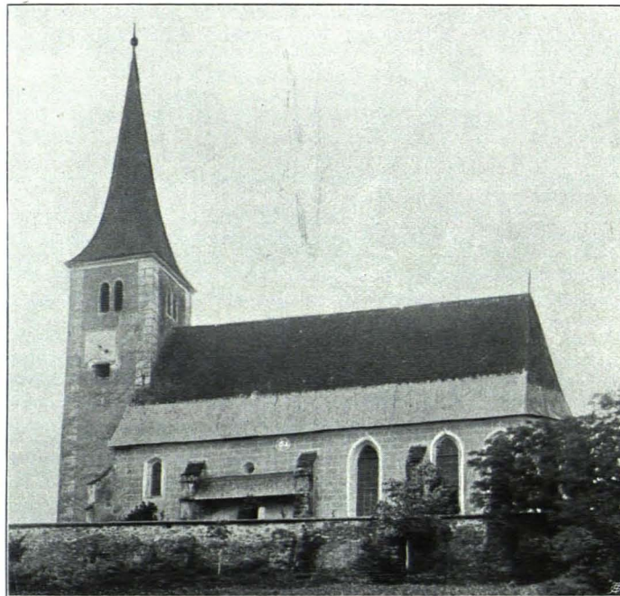
Fig. 72 Leiben, Pfarrkirche (S. 65)

Hauskapelle; im ersten Stocke; über das Portal in den Vorbau hinausragend; kreuzgewölbt mit geringen Stuckornamenten. XVII. Jh.