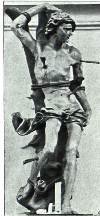
Fig. 68 Madonnenstatue (S. 62) Ebersdorf, Pfarrkirche Fig. 69 Sebastianstatue (S. 62)