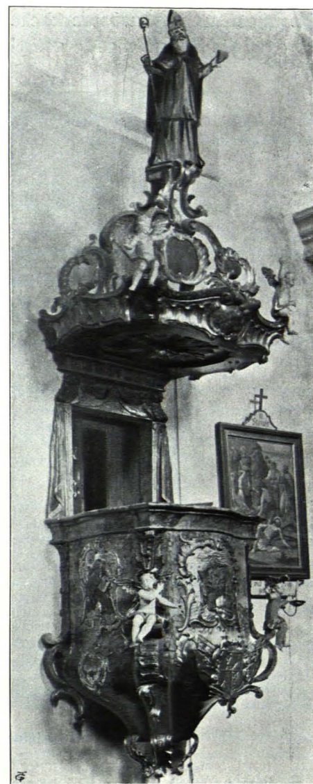
Fig. 70 Ebersdorf, Pfarrkirche, Kanzel (S. 62)