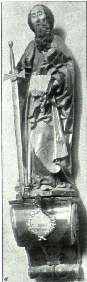
Fig. 35 Gottsdorf, Pfarrkirche, Hl. Paulus, Holzskulptur (S. 34)

Kirchengeräte: 1. Kelch; Fuß aus Messing, Cuppa und Korb aus Silber; flach getrieben, der Korb durchbrochen, mit Engelfiguren ornamentiert; sechs Emailbildchen, rot, monochrom, die Passion darstellend; unechte Steine. Anfang des XIX. Jhs.