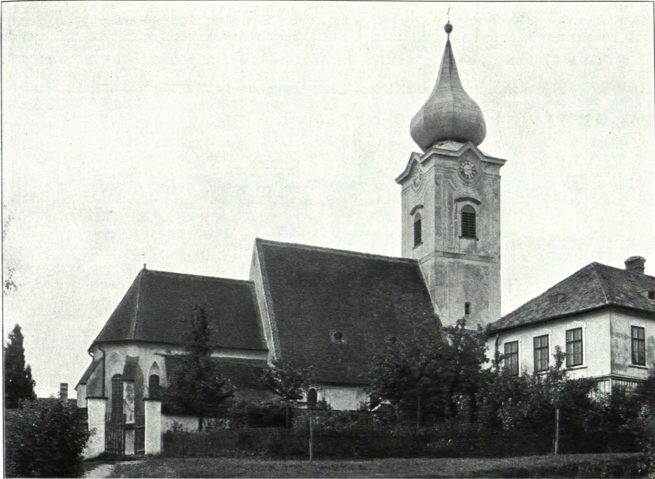
Fig. 33 Gottsdorf, Pfarrkirche (S. 31)