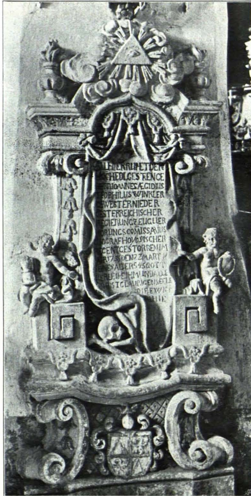
Fig. 38 Gottsdorf, Pfarrkirche, Grabmal des J. Ä. T. Winckler (S. 35)

Möbel: Eingelegte Holzmöbel; ein Betschemel, ein großer zweiflügeliger Kasten und zwei dreiseitige Eckkästen mit alten Beschlägen. Zweite Hälfte des XVIII. Jhs.