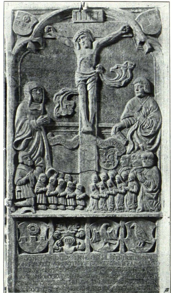
Fig. 39 Gottsdorf, Pfarrkirche, Grabmal des Mang Irnfrid von Rothenhof (S. 35)