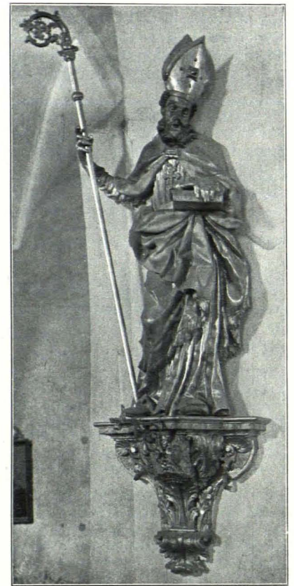
Fig. 36 Gottsdorf, Pfarrkirche, Hl. Nikolaus, Holzskulptur (S. 34)

5. Reliquienostensorium; Kupfer; in Monstranzenform mit zwei anbetenden Engeln. XVIII. Jh.